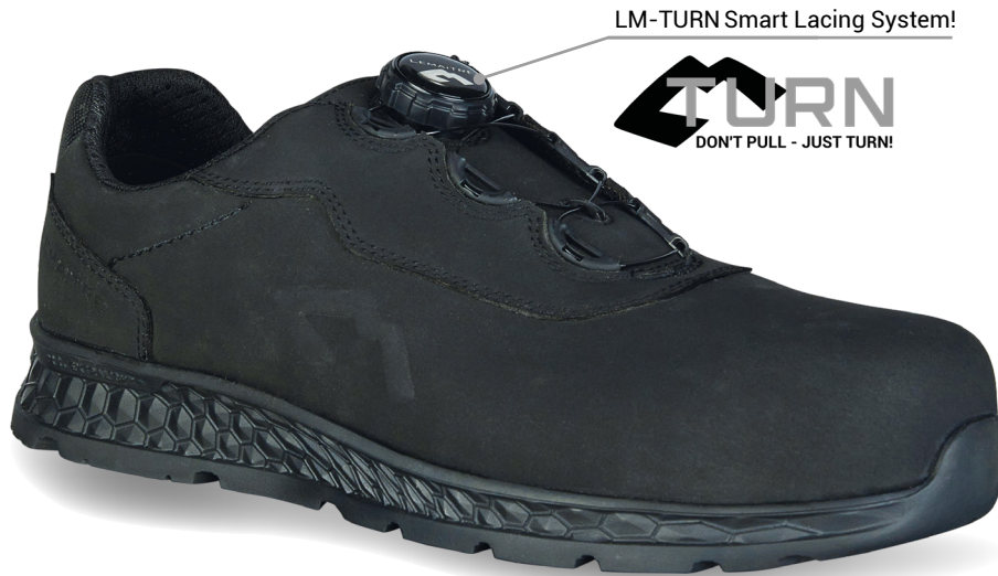
LM-TURN Smart Lacing System!