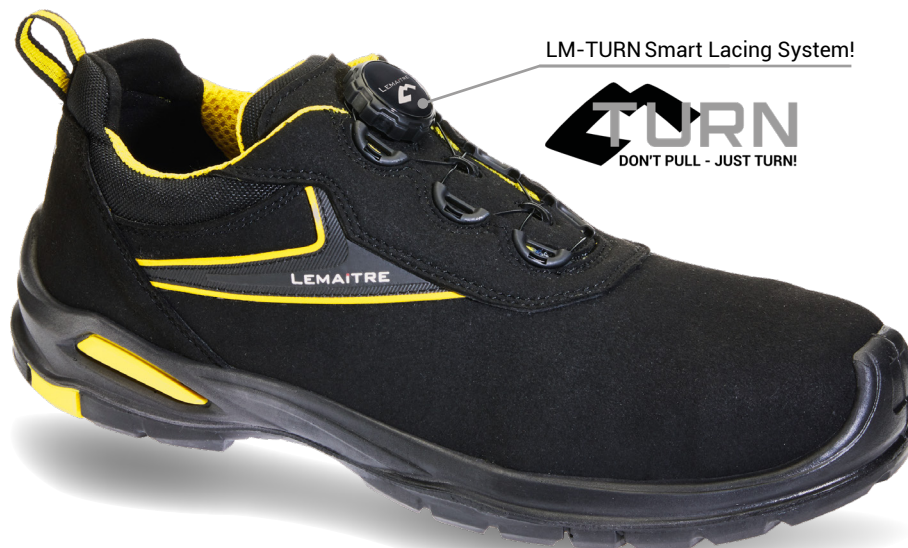
LM-TURN Smart Lacing System!